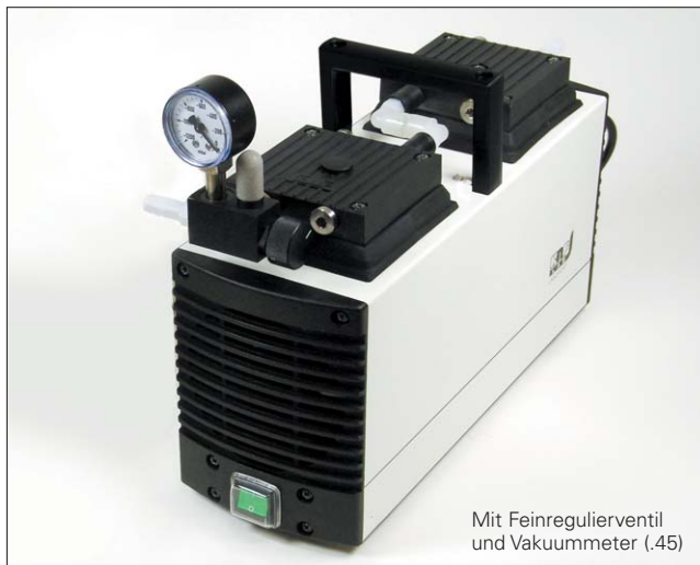
Mit Feinregulierventil und Vakuummeter (.45)